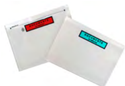
Pochette adhésive porte-document